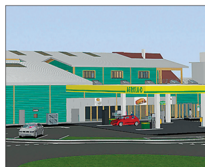
Die Landi baut unter anderem eine grössere Tankstelle. VISUALISIERUNG ZVG

SEMPACH STATION Am vergangenen Montag fand in Sempach Station der Spatenstich zum Ausbau der Landi Sempach-Emmen statt. Der Neubau, der voraussichtlich im März 2015 bezogen werden kann, enthält ein umfangreiches Verkaufsangebot, einen Topshop und eine grössere Tankstelle. Das herkömmliche Angebot wird erweitert und ausgebaut. Zukünftig soll den Kunden auf rund 1000 Quadratmetern 7000 Artikel angeboten werden (Seite 18). RED