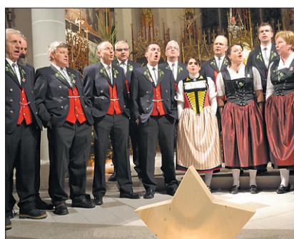
Der Jodelclub Sempach präsentierte den ersten Teil seines Adventskonzertes.

HILDISRIEDEN/SEMPACH Der erste Teil des Adventskonzertes ging für den Jodelclub Sempach mit Erfolg über die Bühne. Er fand in der Pfarrkirche Hildisrieden statt und begeisterte das Publikum. Mit verschiedensten Darbietungen und der Unterstützung von Kindern stimmte der Jodelclub mit seinem Konzert auf die kommenden Festtage ein. Das Adventskonzert wird ein zweites Mal am kommenden Sonntag um 17 Uhr in der Pfarrkirche Sempach aufgeführt (Seite 11). RED